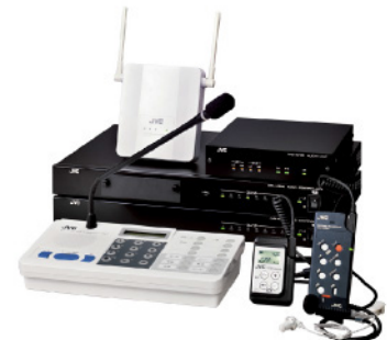
デジタルワイヤレスインターカムシステム WD-3000シリーズ

●仕様および外観は、改善のため予告なく変更することがあります。●記載されている会社名、製品名はそれぞれ各社の商標または登録商標です。●本製品およびシステムは、薬事法に定める医療機器ではありません。