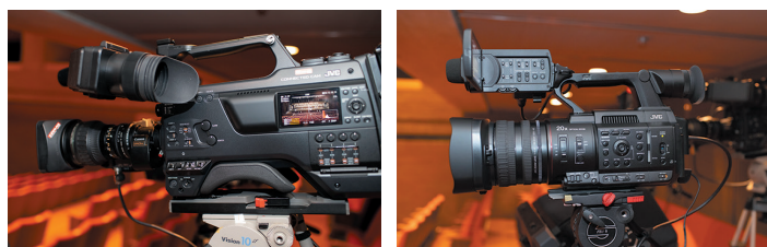
GY-HC900CH と GY-HC500