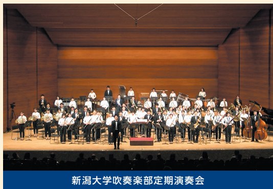
新潟大学吹奏楽部定期演奏会