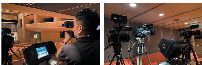
舞台撮影のセッティング風景

GY-HC500は、4K対応光学20倍ワイドズームレンズを採用しており、35mmフィルム換算で約28~560mmと、ステージ上を躍動感あるサイズで切り取ることが可能。さらにHDモードでは、画質劣化が極めて少ない40倍ダイナミックズームを使用すればバストアップサイズまでカバーでき、舞台撮影に適しています。