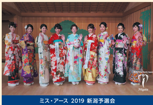
ミス・アース 2019 新潟予選会