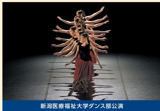
新潟医療福祉大学ダンス部公演