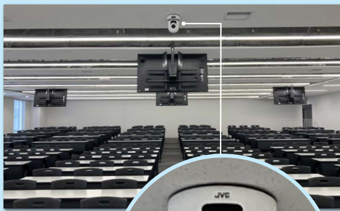
HD PTZ リモートカメラ KY-PZ100W