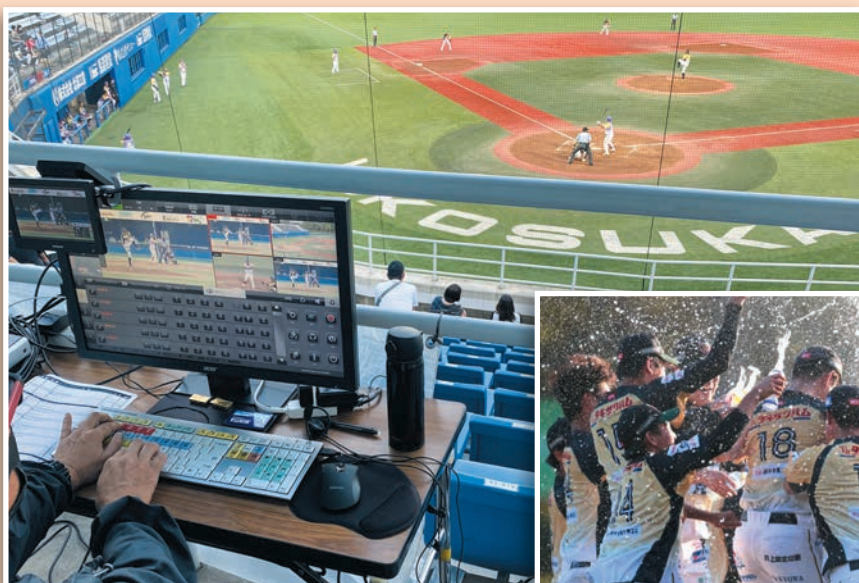
●神奈川県横浜市の球場によるライブ配信の様子