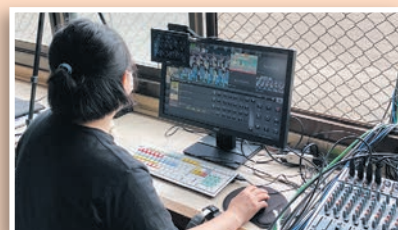
●栃木県小山市の球場