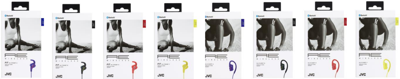
「HA-ET800BT-A」 「HA-ET800BT-B」 「HA-ET800BT-R」 「HA-ET800BT-Y」 「HA-EC600BT-A」 「HA-EC600BT-B」 「HA-EC600BT-R」 「HA-EC600BT-Y」