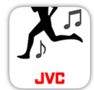
「JVC Run & Music」

本アプリケーションはBPM(Beats Per minute:1分間に刻む音楽テンポ)を利用してランナーの走力アップを効率よくサポートするランナー向けツールです。お手持ちのスマートフォンに収録した音楽のBPMを解析し、目指す距離や時間に合わせて、最適なプレイリストを自動生成します。自分の目標にあった音楽テンポ(BPM)に合わせて走ることで、快適なランニングと走力アップをサポートします。