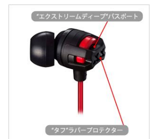
< 本体イメージ >