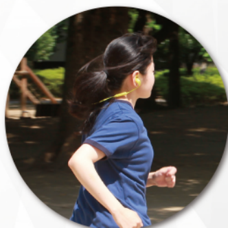
ハードに動いてもイヤホンは外れません

ワイヤレスなのでコードが邪魔にならず体を動かしやすいし、イヤホン本体上部のイヤースポートを耳の溝に押し込むことで、ハードに動いたり汗をかいても外れにくくなっています。休憩時など耳から外したときにはマグネットで左右の本体をくっつけられるので、コードの絡まりや落下を防げます。車のクラクションや自転車のベルといった周囲の音が聞きやすくなる低遮音イヤースポーツも同梱するなど、シニアランナーの使いやすさをとことん追求したモデルです。