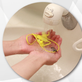
汗で汚れたら水洗いができます