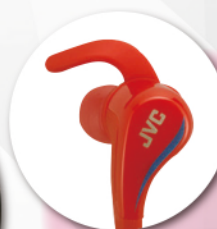
フック状のイヤースポーツで安定した装着感