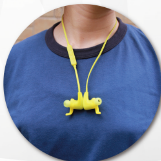
使わない時はマグネットで左右をくっつければ邪魔になりません

ランナー専用スマホアプリ(無料)を使えば楽しく効果的なトレーニングが可能です。走る時間や距離を入力すれば、それに合わせてスマホの中の音楽からプレイリストを自動生成。設定したペース配分に合わせたテンポの曲を自動選曲してくれるので、ペースコントロールも容易です。本体は充電式で、連続使用9時間※とフルマラソンの練習にも十分。防水仕様(IPX5)なので急な雨でも安心だし、汚れたら水で洗って清潔に保つことができます。